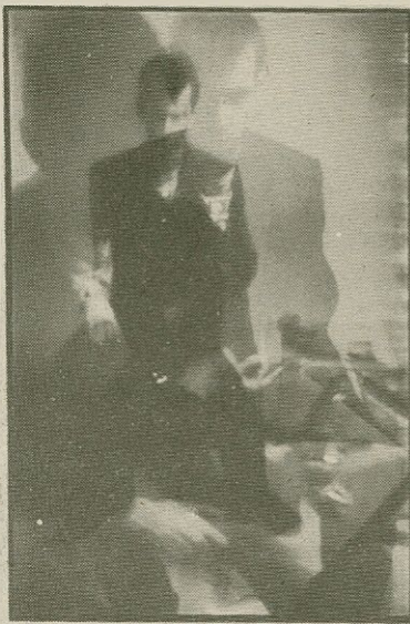
'Snapshots', muntatge fotogràfic de Mabel Palacín i Marc Viaplana

Mabel Palacín i Marc Viaplana desenvolupen la seva obra a partir de staged photographs o fotografies construïdes, una forma d'expressió que es desenvolupa a finals dels setanta com a reacció contra el realisme fotogràfic: les imatges d'aquestes noves fotografies són realitats inventades i preparades per l'autor. A Snapshots , com en