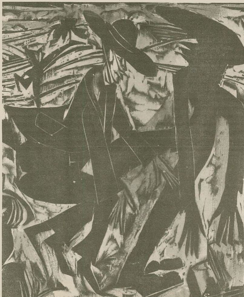
'Trobada del pobre diable amb l'ombra', d'Ernst Ludwig Kirchner

La temàtica expressionista es nodreix de la interiorització que l'artista fa de les imatges quotidianes: paisatges, gent, carrers o cafès es transformen en natura deformada i amenaçadora, en éssers que protagonitzen situacions dramàtiques o en escenaris d'un malson. La misèria, la malaltia o qualsevol altra forma de degradació física o moral apareixen reiteradament a les obres expressionistes. El color, alliberat de les limitacions impressionistes que el destinaven a la reproducció de la visió de la retina, col·labora també a crear aquestes atmosferes inquietants.