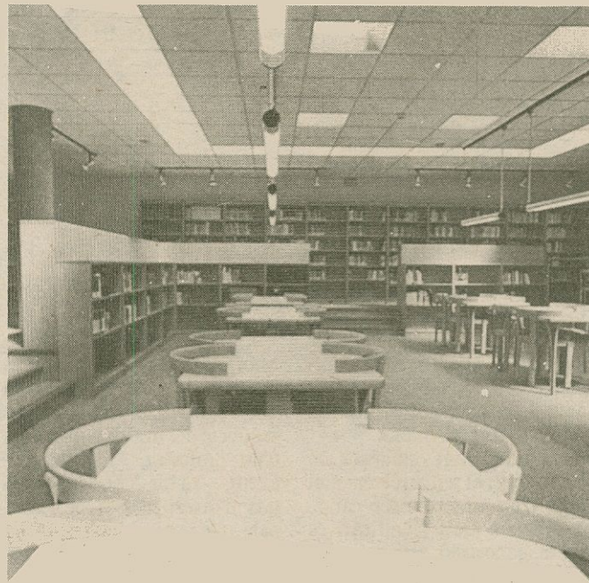
Interior de la biblioteca de Sant Feliu de Bages, inaugurada fa una setmana