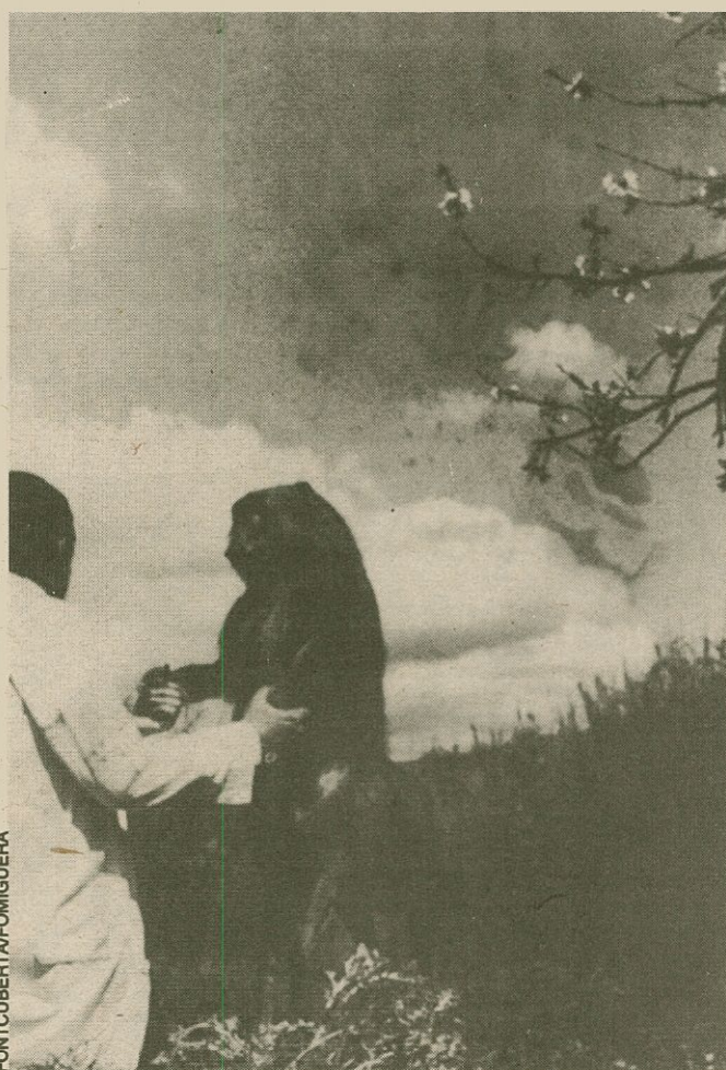
L'ajudant del professor Ameyshausen saluda un centaure

"Ser és ser fotografiat", deia l'escriptor Borges. Joan Fontcuberta i Pere Formiguera, fotògrafs, ho saben millor que ningú. Dijous en faran la demostració al Museu de Zoologia