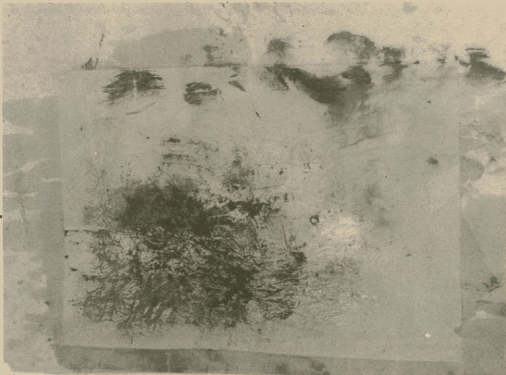
'Doble groc', obra sobre paper que explora les possibilitats de transparència i vaporositat

Blau i vermell, Doble groc o Taca vermella , títols d'algunes de les obres de l'exposició, denoten l'interès que Margarida Andreu té pel color i les seves possibilitats plàstiques. El paper de seda, un altre component essencial d'aquestes pintures, és un suport fràgil que proporciona determinades qualitats a l'obra (transparència, absorció, vaporositat,...) i canvia la idea del suport rígid i inamovible per la d'un element susceptible de ser manipulada.