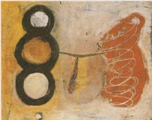
Ferran Garcia Sevilla "Atala 2" 1984 Tècnica mixta sobre tela 130 x 162 cm