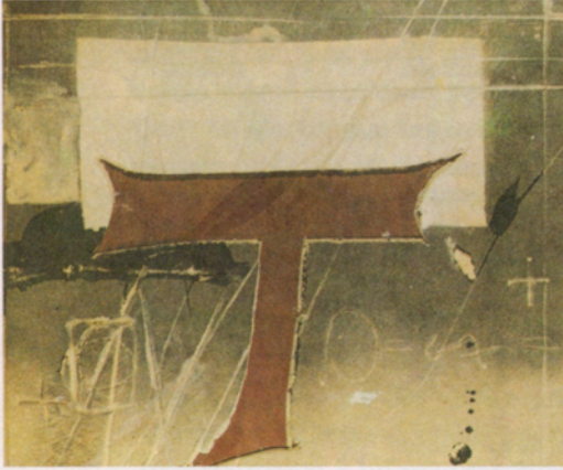
Antoni Tàpies "T Rogenca" 1981 Procediment mixt / fusta. 54 x 65 cm