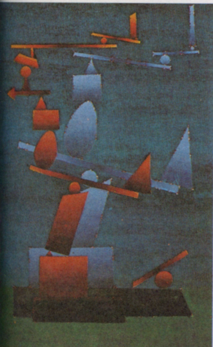
Joan Ponç "Equilibri vertical" 1977-1978 Oli damunt tela 46 x 65 cm