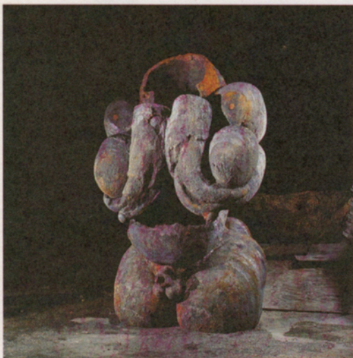
Jaume Plensa «Escullera» 1986 265x160x150 cm